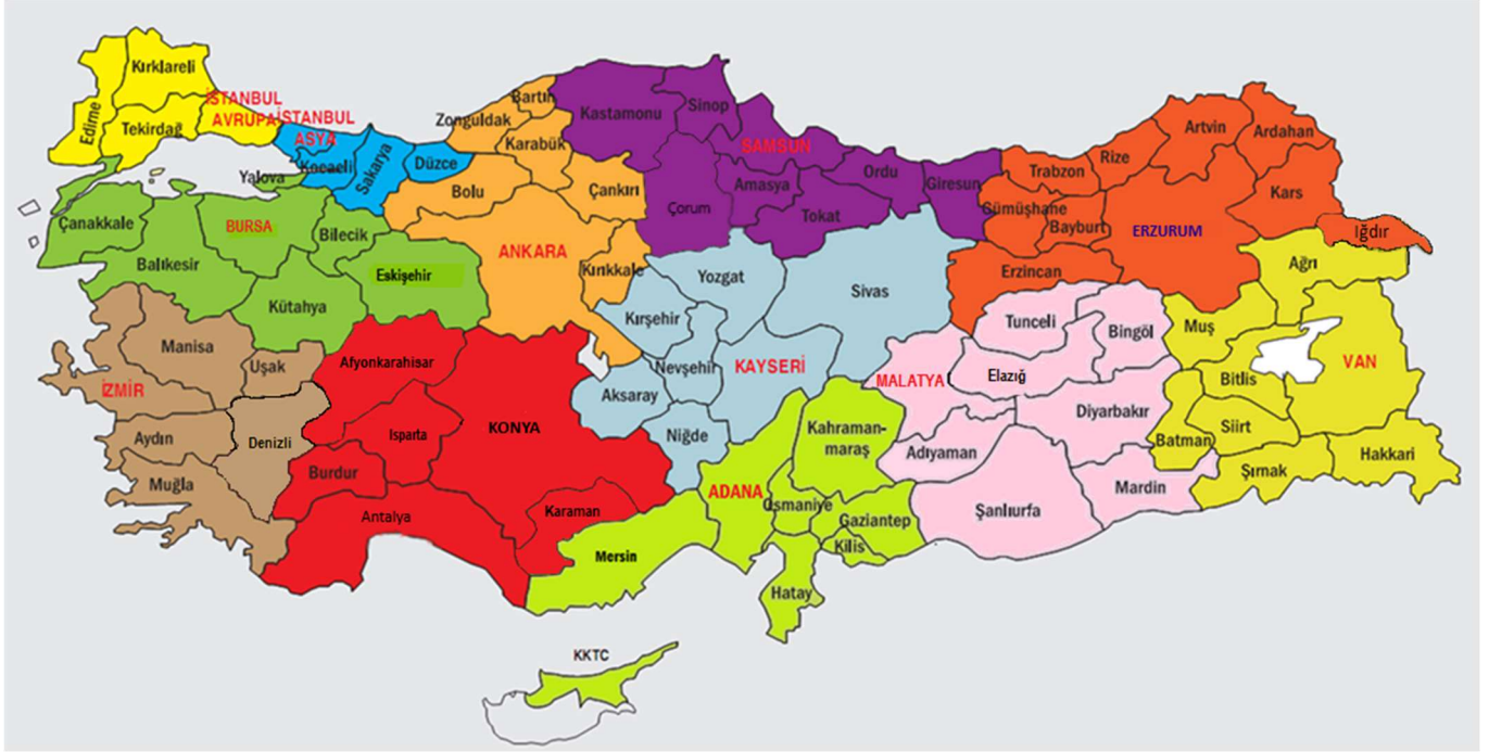
Şekil 1. Yarışma Bölgeleri Haritası

Bu yarışma Türkiye genelinde 12 bölgede yapılmaktadır. Her bölge için bir il, merkez olarak seçilmiştir. Her bölgeye il merkezinden iki öğretim üyesi, TÜBİTAK tarafından yarışmalardan sorumlu Bölge Koordinatörü ve Bölge Koordinatör Yardımcısı görevlendirilir. Adana, Ankara, Bursa, Erzurum, Konya, İstanbul Asya, İstanbul Avrupa, İzmir, Kayseri, Malatya, Samsun ve Van bölge merkezi illerdir. İllerin bölgelere dağılımları Şekil 1’de verilmiştir.